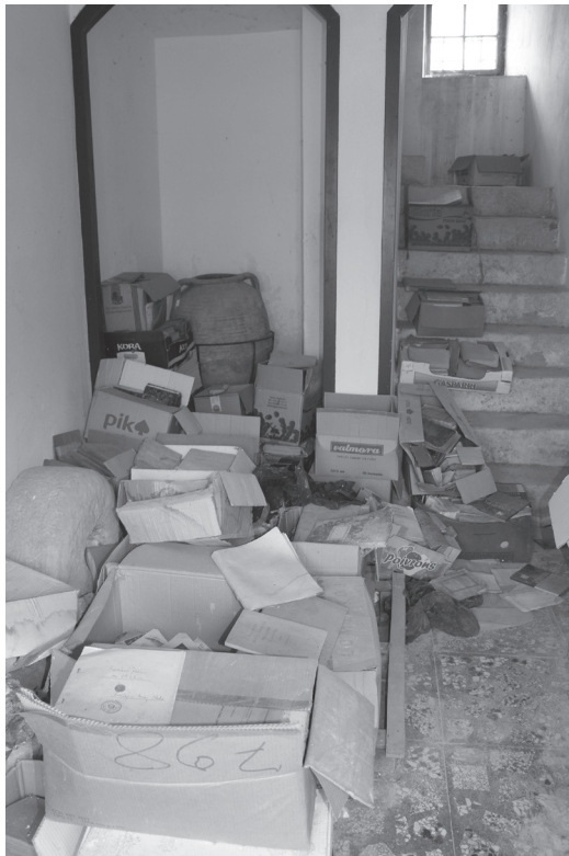
Slika 6. Zatečeno stanje u kaštelu Arneri 2. travnja 2025.