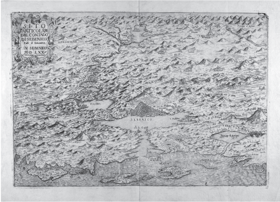
Immagine 5 Veduta di Sebenico e del territorio circostante, incisione (Venezia, 1570). ASMo, Mappario Estense, Territori n. 227.