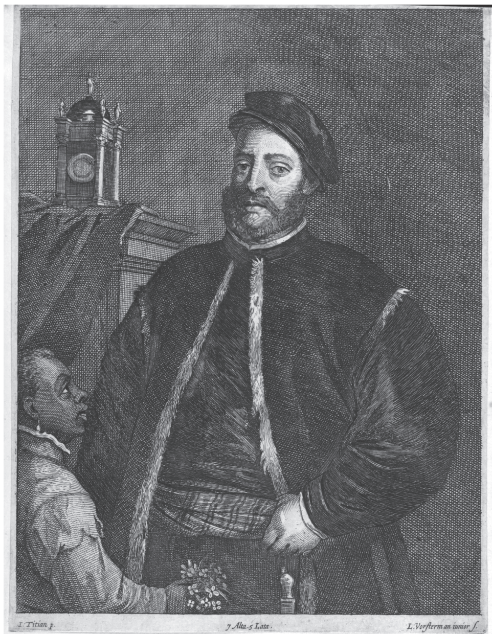
Immagine 4 Ritratto del mercante Fabrizio Salvarezza, incisione tratta dal dipinto di Tiziano conservato al Kunsthistorisches Museum di Vienna, (L. Vosterman, Anversa, sec. XVII). Collezione privata.