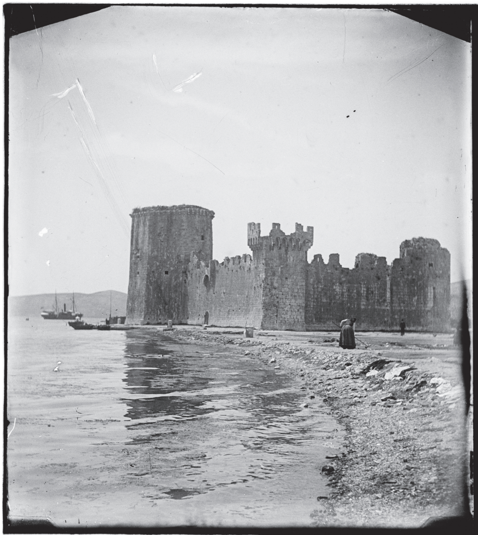
Slika 3. Na obali: žena pri radu pred Kamerlengom, Giuseppe Primoli, Inv. br. 8593/A, Fondazione Primoli, Rim.

(1842. – 1901.), prvi narodnjački načelnik. 39 Ethel Mary Smyth (1858. – 1944.) bila je britanska skladateljica, dirigentica, spisateljica i sufražetkinja. U njezinoj je biografiji, među ostalim, istaknuto da se borila protiv društvenih ograničenja koja su govorila da žena ne bi trebala imati zanimanje te da je inzistirala na obrazovanju,