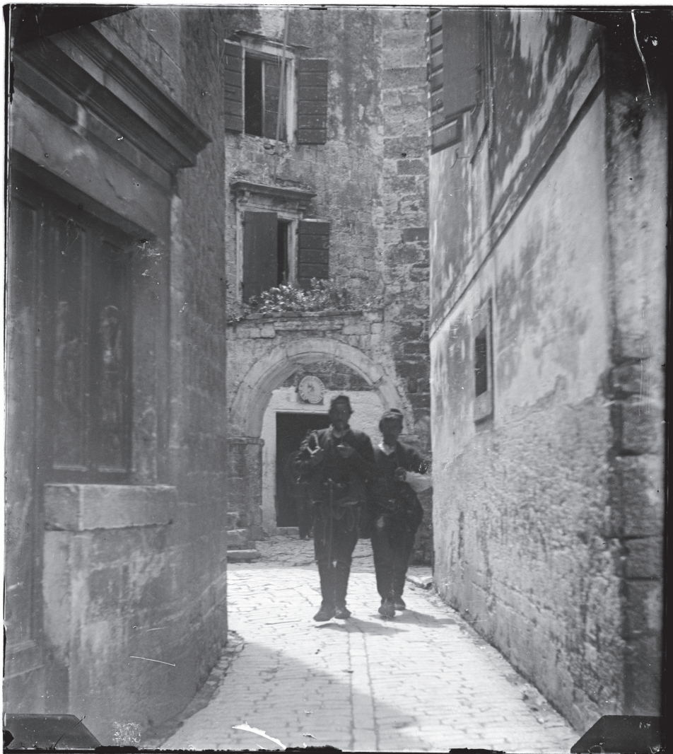
Slika 6. U prolazu: Muškarci pored palače Garagnin-Fanfogna, Giuseppe Primoli, Inv. br. 4875/A, Fondazione Primoli, Rim.