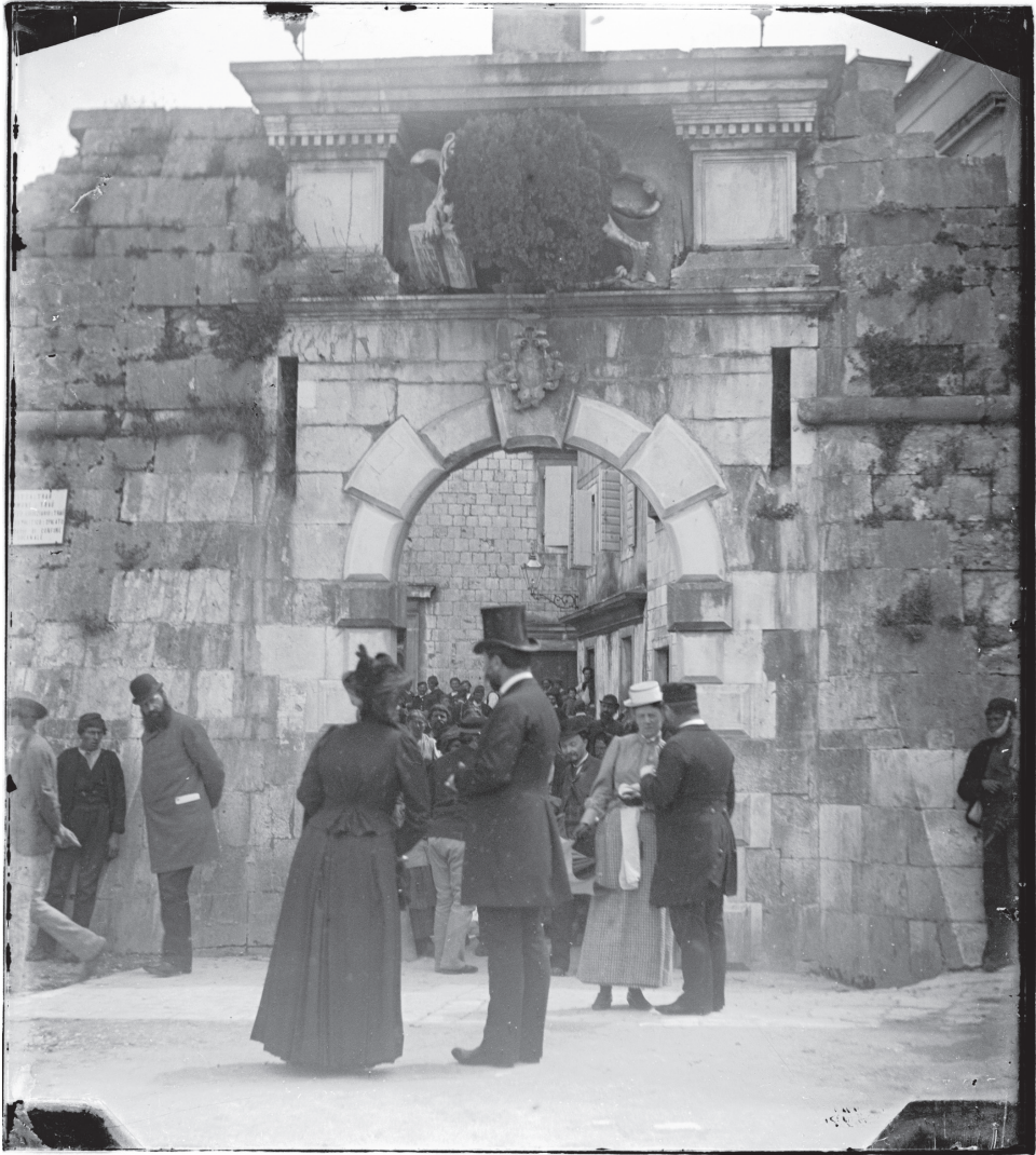
Slika 5. Pred sjevernim gradskim vratima, Giuseppe Primoli, Inv. br. 4647/A, Fondazione Primoli, Rim.

pred katedralom, na cimatoriju, također u spontanom trenutku. 42 Carica Eugenija, Ethel Smyth i Špiro Puović ovjekovječeni su i ispred sjevernih gradskih vrata na kojima se, na trgu Gradska vrata, vidi zainteresirano mnoštvo građana. 43 Interesantno je vidjeti i „legendarni“ čempres koji je rastao nad gradskim vratima gotovo u cijelosti prekrivajući reljef mletačkog lava. O čempresu piše Ivo Delalle: „Ispod