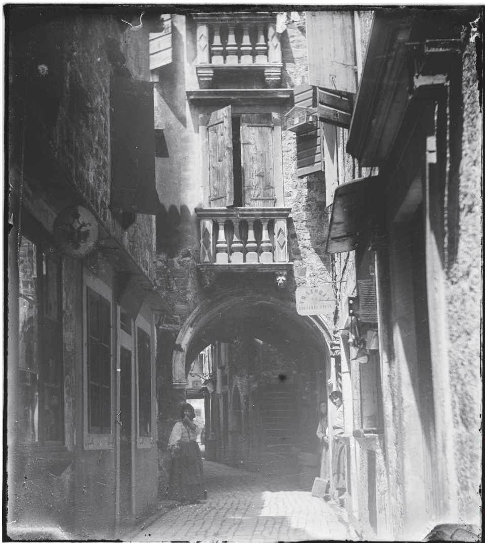
Slika 7. Prizor iz glavne gradske ulice - prolaz nadsvoděn kućom Cippico – Gavalla, Giuseppe Primoli, Inv. br. 8947/A, Fondazione Primoli, Rim.

Giovanni di Medua e Santiquaranta (Turska. Shëngjin i Sarandë 56 ), De Trieste a Corfou (Od Trsta do Krfa), Turchia (Turska) te Le rive dell'Adriatico: Coste turche (Obale Jadrana: turska obala).