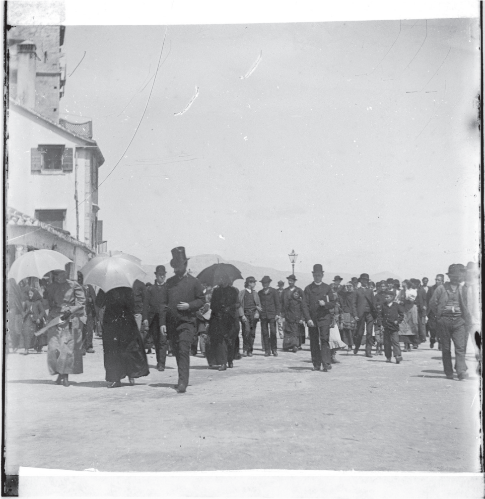
Slika 4. Na obali: mnoštvo građana prati uvažene goste, Giuseppe Primoli, Inv. br. 8781/A, Fondazione Primoli, Rim.

izvedbama svojih skladbi te objavljivanju svojih književnih djela. Osim skladanja, Smyth je također predano pisala pisma, a kasnije se u životu okrenula pisanju memoara i eseja, objavivši deset tomova proze između 1919. i 1940. godine. Tijekom svoje duge karijere, u kojoj je često putovala između Engleske, Njemačke i Italije, Smyth je upoznala Johannes Brahmisa, Claru Schumann, Petra Iljiča Čajkovskog, Edvarda Griega, Brunu Waltera i druge. Neformalno je nastupala za kraljicu Viktoriju, a bila je prijateljica s bivšom francuskom caricom Eugenijom. 40