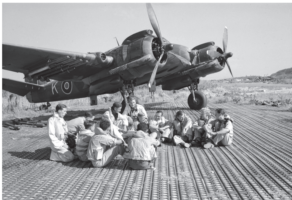
Slika 3. Piloti prije polijetanja 45

Piloti, koji na putu lete u dijagonalnoj formaciji, bilježe lijepo vrijeme, pomalo magličasto, uz vidljivost 5 do 8 milja. Sudeći prema sačuvanoj bilješci iz Dnevnika dr. Katića, toga 14. kolovoza u Dubrovniku je bila nesnosna vrućina, 46 a stanovništvo pod višemjesečnim danonoćnim zračnim uzburkavanjima zbog prelijetanja savezničkih aviona u akcijama u balkanskom zaleđu te zračnih napada na Dubrovnik i okolicu. 47 Približivši se cilju, saveznički su se zrakoplovi prestrojili u napadačku formaciju jedan iza drugoga te u izrazito niskom letu u 19 sati započeli napad toliko iznenadno da se zračna uzbuna, kako bilježi dr. Katić, uopće nije oglasila. I dok su zrakoplovi prelijetali južni dio gradske jezgre, on se, užasnut neočekivanom