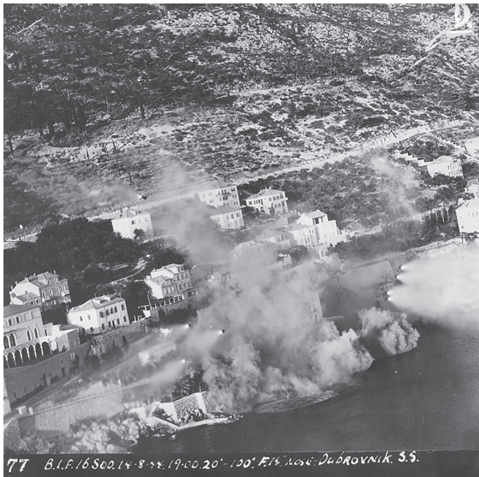
Slika 4. Raketni napad iz zrakoplova poručnika Ashdowna

Najviše uspjeha u raketiranju imao je zrakoplov „S“ poručnika Ashdowna. On je napao hotel Excelsior ispalivši svojih osam raketa s udaljenosti između 550 i 730 m od mete, pri čemu je bio izravno pogoden gornji desni dio zgrade te su uočeni dim i krhotine.