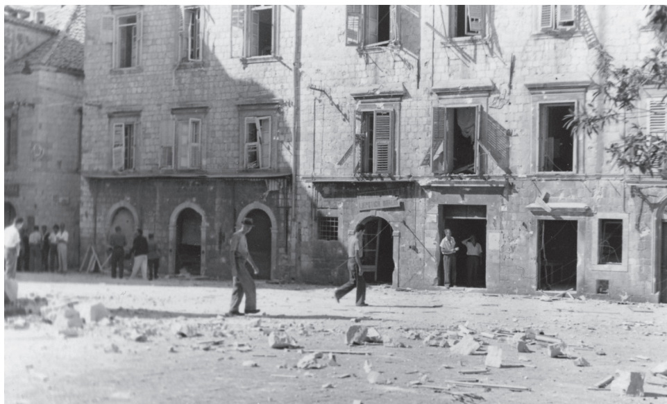
Slika 5. Gundulićeva poljana nakon bombardiranja 77

Orepić, dućani Ljepotica, Ljubimira itd. Našla smrt u svome malom dućančiću u korti trebinjca Vuletića: Mile Vuletić Malenica, koja je prodavala duhan i jedan Rus u korti Hotela de la Ville. Strašno je to doći bacati na centrum Grada i u uru, kad se jadni svijet odmara. Bog im prostio, ali je naše zdravlje pokošeno. 76