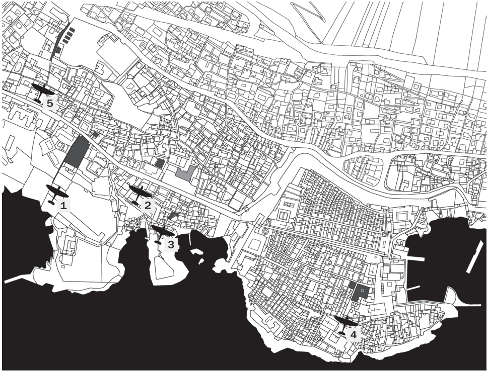
Slika 7. Prikaz svijiu pet trasa bombardiranja 27. kolovoza 1944. u prvom i drugom naletu 106

mačku vojsku, osobito vezane uz utvrđenje obalnoga područja. 104 Na to su područje, prema našim procjenama, pale ukupno četiri bombe nanoseći značajne štete. 105